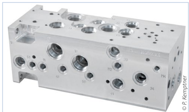
Die Hydraulikblöcke sind in allen Richtungen von komplexen Bohrungen durchzogen. Diese müssen während und nach der Fertigung von Verunreinigungen befreit werden.