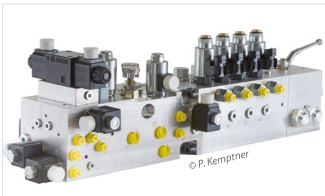
Hydraulik-Steuerblöcke steuern durch Verteilung der Fluidströme hydraulische Antriebe in Schwer- und Spritzgussmaschinen, selbstfahrenden Arbeitsmaschinen und der Landtechnik.

Zudem sind die Reinheitsanforderungen weiterhin im Steigen begriffen. Mit dem Ziel, den Restschmutzwert zu reduzieren, machte sich Power-Hydraulik Mitte 2014 auf die Suche nach einer neuen, besseren Lösung. „Zugleich mit dem Reinigungsergebnis sollten die Abläufe rund um die Teilereinigung verbessert werden, um eine zukunftsfähige Lösung für die nächsten