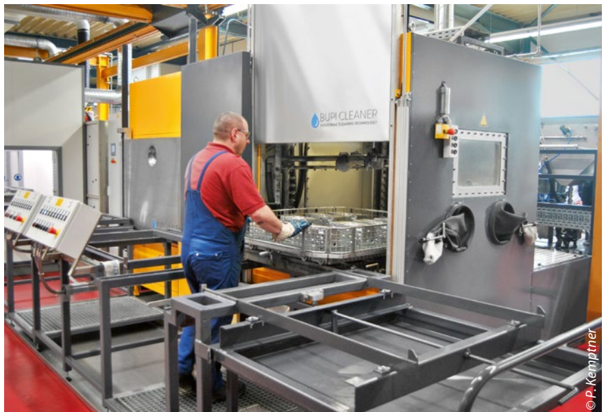
Eine Rollenbatterie verbindet die Zweibad-Spritzreinigungsanlage (vorne) mit dem Vakuumtrockner und zwei geschlossenen Handarbeitsplätzen

Bei seinen Nachforschungen stieß Roth auch auf die Reinigungsanlagen von Bupi Golser und dessen Vertriebspartner für Südwestdeutschland, die RTG cleantec. Die Systemberatung von RTG führte zur Wahl einer Powertec Pro (Zweibad-Anlage) mit getrenntem Reinigungsmittel- und Spülwasserkreislauf. Damit lassen sich die oft unterschiedlichen Anforderungen bei Zwischen- und Endreinigungen be-