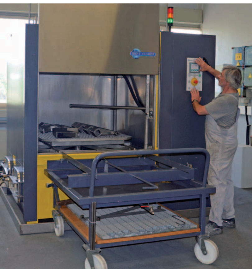
In der Reinigungsanlage werden Gehäuse aus Grauguss sowie Großbauteile mit komplexen Geometrien gereinigt.

Bei Fortuna werden die verschmutzten Gehäuse direkt nach ihrer Bearbeitung mit dem Zubringerwagen und Gitterrost der Powertec-Anlage zugebracht. Um eine allseitige Beaufschlagung mit der rund 65°C heißen Waschflüssigkeit aus Tank 1 zu gewährleisten, sorgt ein Reibradantrieb für eine gleichmäßige Rotation des Waschguts während des Reinigungsprozesses. Die ausgespülten Späne werden im leicht zu reinigenden Rücklaufkorb aufgefangen. Nach dem Abtropfen der Bauteile folgt ein Spülschritt bei 65°C aus Tank 2. Um Medienverschleppungen zu vermeiden, sind