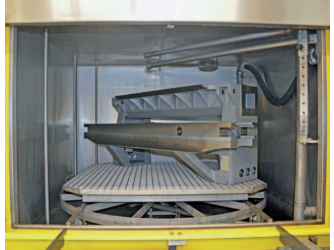
Der Reibradantrieb gewährleistet eine gleichmäßige Drehung des Waschguts während des Reinigungsvorgangs.